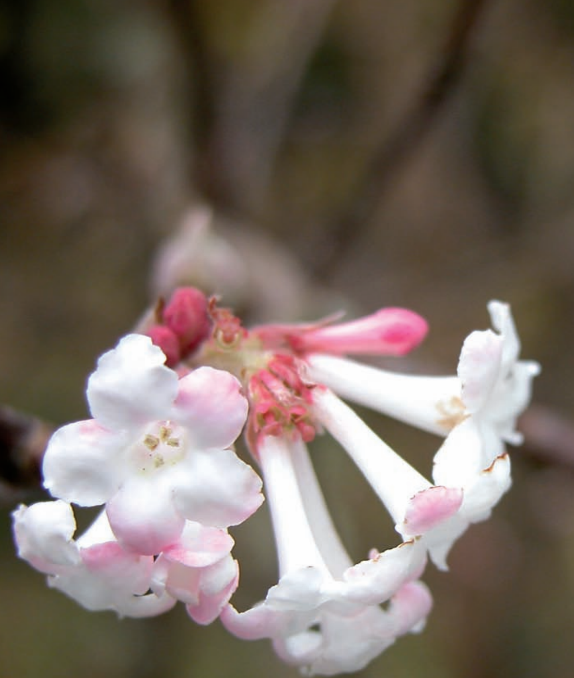
Keisarkrossved ( Viburnum x bodnantense 'Charles Lamont').