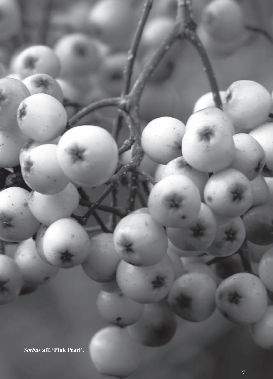
Sorbus aff. 'Pink Pearl'.