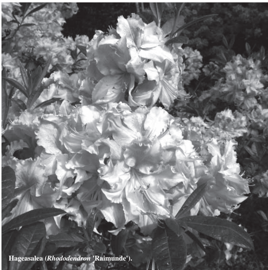
Hageasalea ( Rhododendron 'Raimunde').

Første helga i mai blei 2 personar filma av overvåkingskameraet på parkeringsplassen. Vi kunne tydeleg sjå korleis kjeltringane brekte opp og øydela sokkelen på P-automaten. Dei slo også ut lyset på masta med kraftige slag mot denne. Dessutan prøvde dei å brekka ut dekslet på toppen av pengekassen ved Grevlingveien. Dei arbeidde i 1 ¼ time på P-automaten utan å få 5 øre i utbytte. Vi sat att med påførde skader for godt over 20.000 kr, og måtte reparera myntboksen, skifta ut sokkelen, tilpassa, slipa og sveisa og flytta over "innmaten". Tjuvane blei for øvrig identifiserte ved hjelp av kjennemerket på bilen, og seinare henta inn og bøtelagde på bakgrunn av videoopptaket.