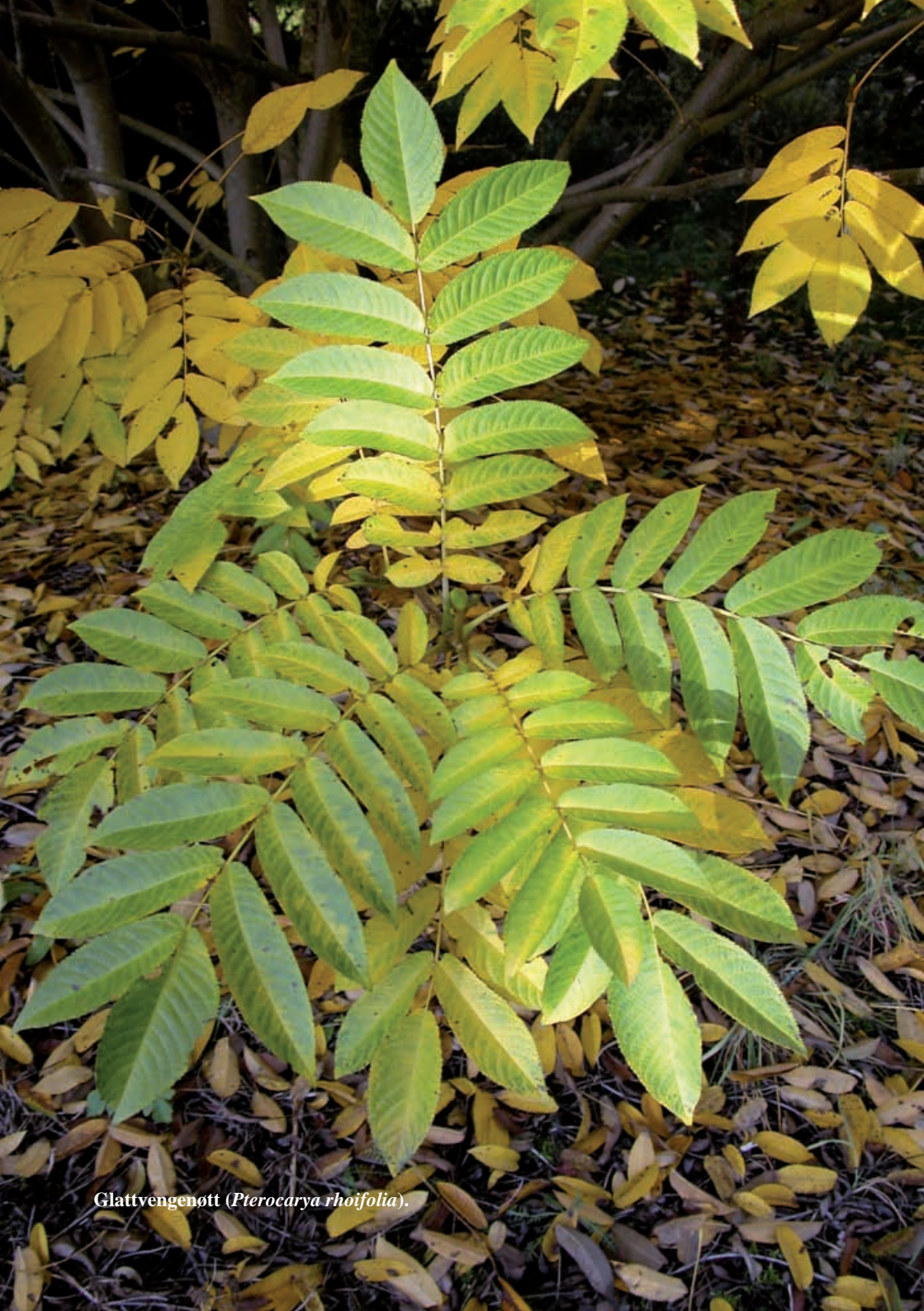
Glattvengenøtt ( Pterocarya rhoifolia ).